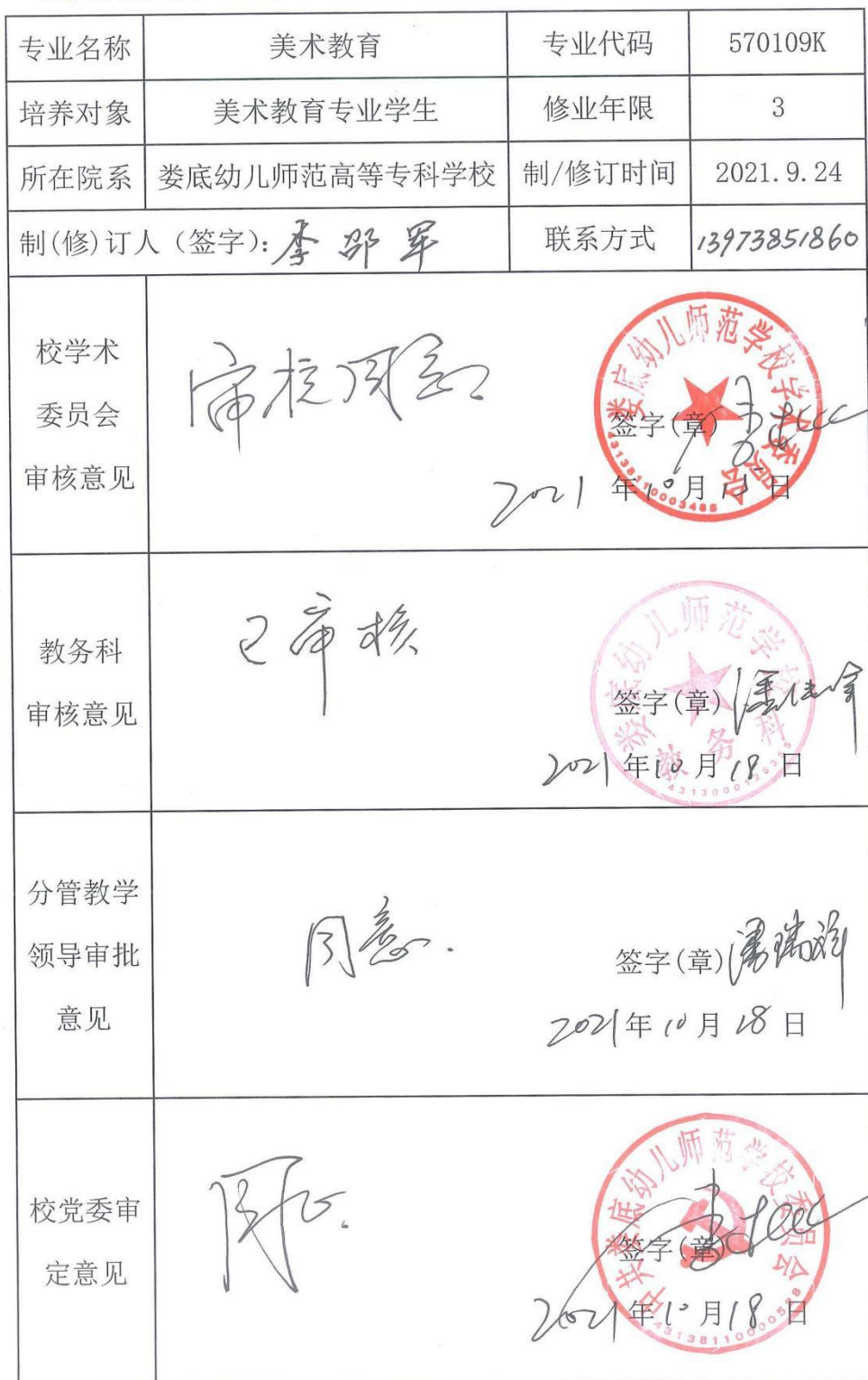
娄底幼儿师范高等专科学校专业人才培养方案审核表